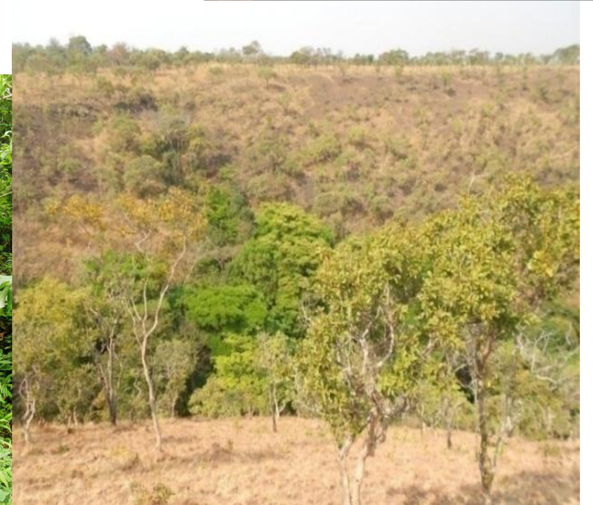
Perte de l'habitat

Le Parc National de la Rusizi affiche à la fois une faible diversité spécifique et une faible abondance à cause de la fragmentation et du défrichement élevés observés dans ce milieu.