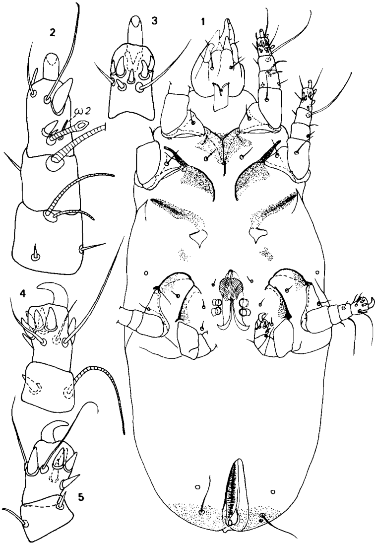
FIG. 1 à 5. — Schwiebea (Jacotietta) longibursata n. sp.: 1. Holotype femelle vu ventralement ; 2. Tarse, tibia et genu I dorsalement ; 3. Tarse I ventralement ; 4. — Tarse et tibia III latéralement ; 5. Tarse et tibia IV latéralement.