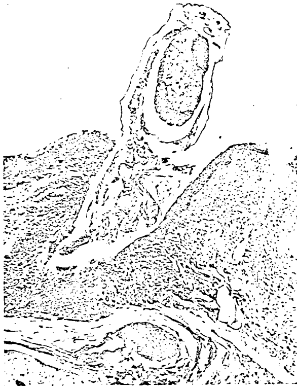
Fig. 1. — Parasite fixé dans la trachée. Remarquer les pièces buccales du parasite fixées dans le chorion et entourées de cellules géantes. Remarquer également l'accumulation cellulaire au niveau de l'implantation dans le chorion et les altérations de la muqueuse (métaplasie).

Sur une de nos préparations (Fig. 1 et 2) on distingue très bien les deux pièces du rostre profondément enchassées dans le chorion. Le corps du parasite est moulé dans une dépression en forme d'entonnoir formée par un pli de la muqueuse.