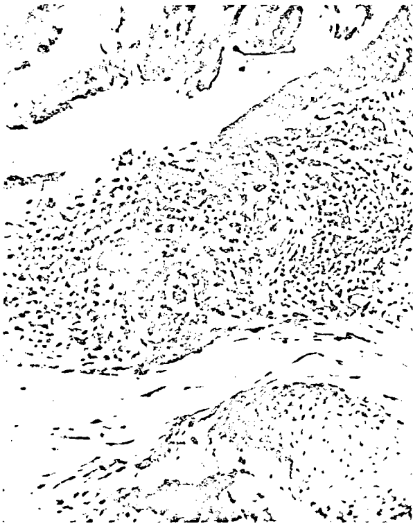
Fig. 2. — Même préparation que la fig. 1, mais zone du chorion vue à un plus fort grossissement, montrant les cellules géantes autour des pièces du rostre bien visibles.

L' épithélium qui tapisse les versants de cet entonnoir a subi une métaplasie quasi épidermoïde. Rappelons que normalement il est pseudostratifié, constitué de hautes cellules cylindriques ciliées et dont certaines sont mucipares. Au niveau de la région métaplasiée on ne trouve plus de cellules ciliées ou mucipares et la stratification apparaît très nettement en plusieurs couches superposées : alors que la couche profonde est constituée de cellules encore plus ou moins cylindriques,