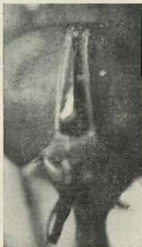
Fig. 1. — Tête de Tabanocella Schoutedeni n. sp., vue de face, montrant la callosité frontale.

Ailes. — Plus assombries que chez Tab. perpulchra et Tab. stimulans . Une large bande d'un brun très foncé part du bord antérieur de l'aile au niveau du stigma et aboutit dans la cinquième cellule marginale, se continuant jusqu'au bord postérieur de l'aile en s'éclaircissant quelque peu. L'apex de l'aile est occupé par une zone également très sombre