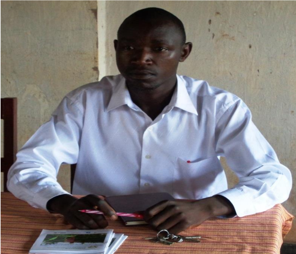
Figure 9: Allocution du Directeur de l'ITABU Kigamba

Après le mot de bienvenue prononcé par le Chef du Parc National de la Ruvubu, deux exposés ont été présentés l'un par l'Expert en Biodiversité et l'autre par le chercheur de l'Office Burundais pour la Protection de l'Environnement (OBPE).