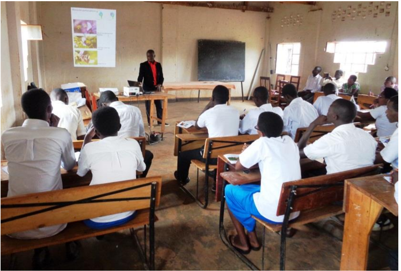
Figure 11 : Exposé du chercheur à l'OBPE

Après l'exposé, il a donné une séance de montrer aux étudiants (Figure 12 : A) et leurs encadreurs (Figure 12 : B) comment conservé les insectes pollinisateurs dans les boîtes entomologiques