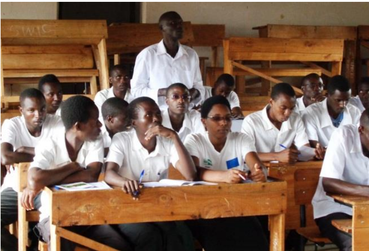
Figure 13: Séance de demande des questions par les participants

Le chercheur les ont répondu qu'il est disposé à le faire. Ils se sont convenus d'aller à la recherche des moyens pour le renforcement des capacités des enseignants d'Entomologie et pour constituer le matériel didactique aussi important pour les étudiants. Les étudiants ont signalé que cette idée est très importante et qu'ils attendent impatiemment la mise en place de ce matériel.