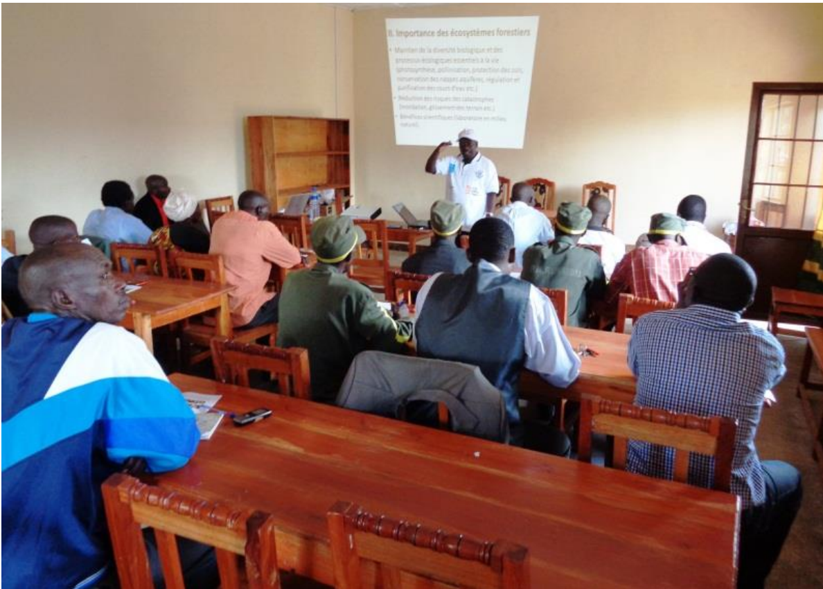
Figure 4 : Exposé de l'Expert en Biodiversité à l'OBPE

Le deuxième l'exposé intitulé « Protégeons nos insectes pollinisateurs pour l'augmentation de la production agricole » a été présenté par le chercheur de l'OBPE (Figure 5).