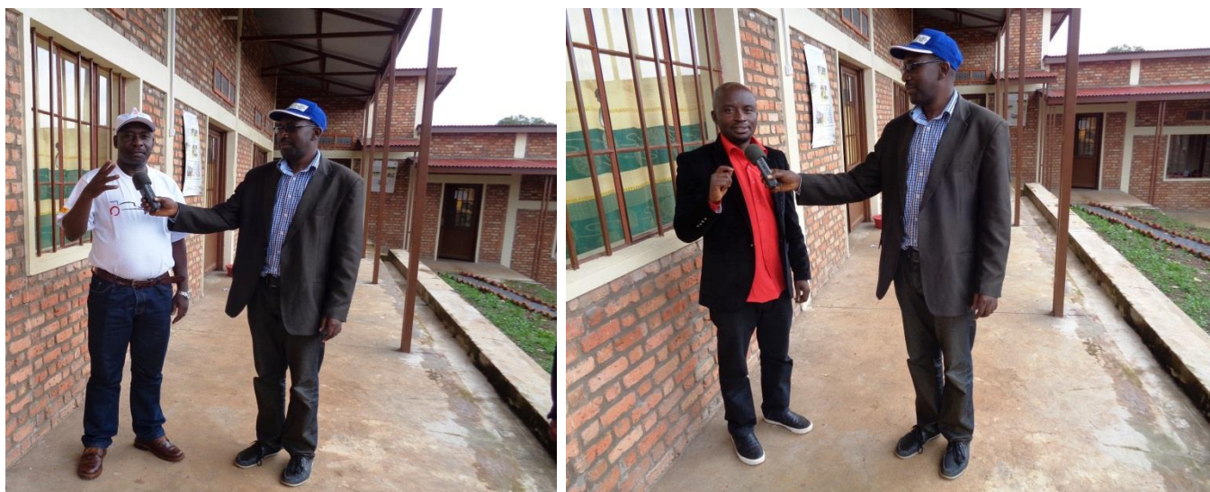
Figure 8 : Interview des animateurs de l'atelier

Enfin, les animateurs ont été interviewés par le journaliste de l'émission environnement de la radio scolaire Nderagakura pour parler le but de l'atelier qui vient d'être mené (Figure 8).