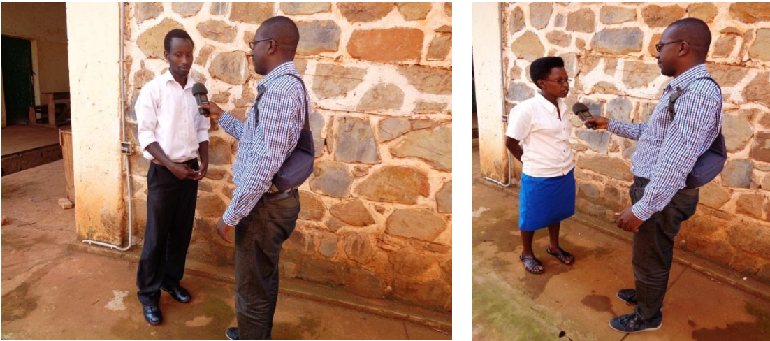
Figure 14: Interview des participants à l'atelier

Enfin, certains participants à cet atelier ont été interviewés par le journaliste de l'émission environnement de la radio scolaire Nderagakura (Figure 14).