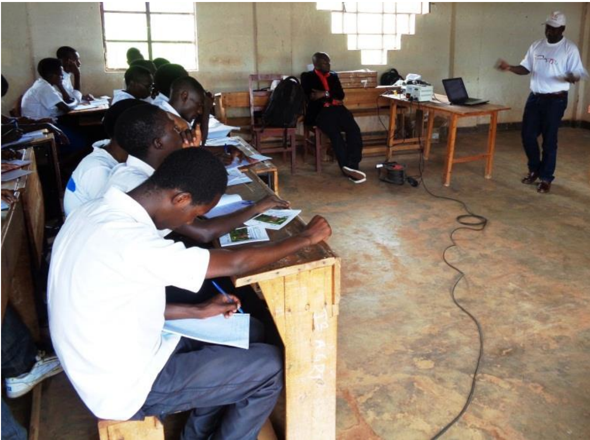
Figure 10 : Exposé de l'Expert en Biodiversité à l'OBPE

Le deuxième l'exposé intitulé « Protégeons nos insectes pollinisateurs pour l'augmentation de la production agricole » a été présenté par le chercheur de l'OBPE (Figure 11).