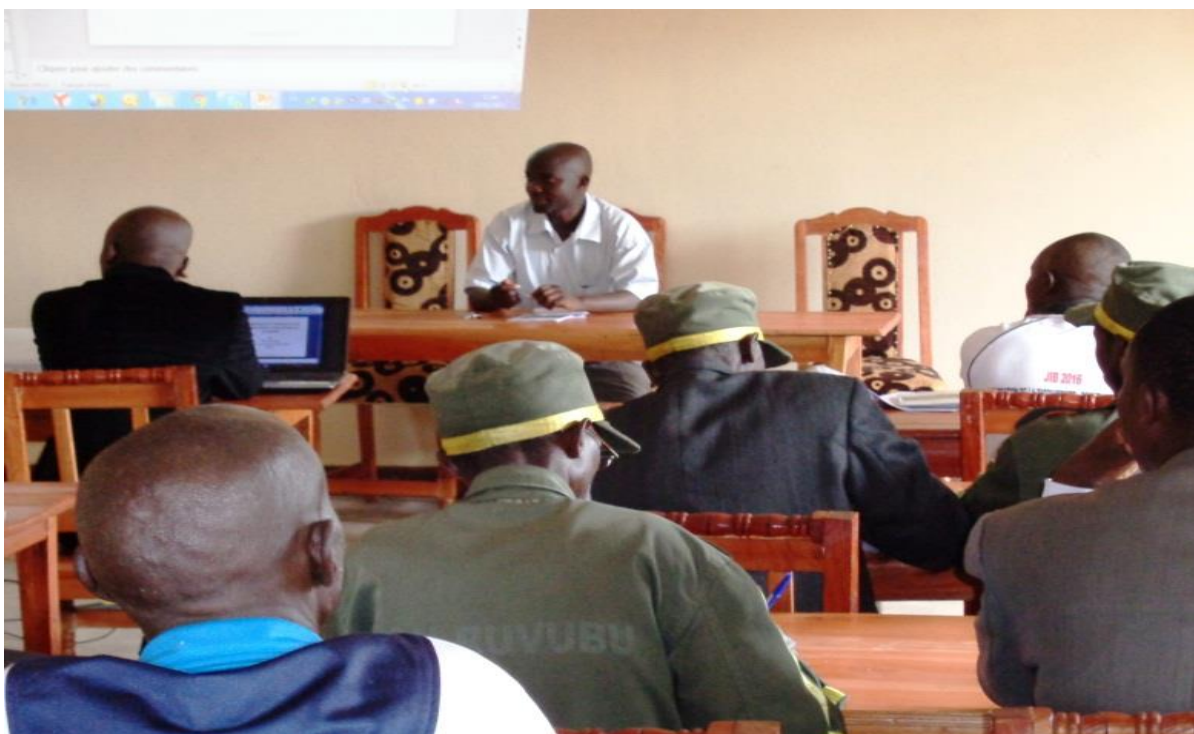
Figure 3 : Allocution du chef du Parc National de la Ruvubu

connaissent. Il a enfin donné la parole aux visiteurs pour transmettre aux participants le message qu'ils ont apporté.