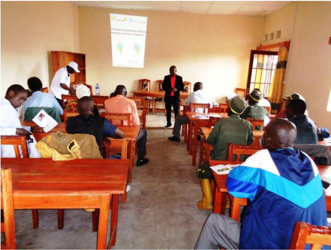
Figure 5 : Exposé du chercheur à l'OBPE

Il a enfin terminé son exposé en signalant que si les pollinisateurs disparaissent, il n'y aurait plus de plantes, plus à manger et qu'il faut prendre conscience pour protéger et sauvegarder les pollinisateurs pour sauvegarder notre survie.