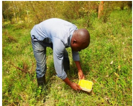
Collecte des insectes avec bocaux jaunes