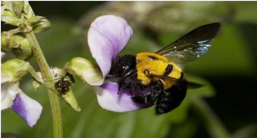
Une abeille du groupe des xylocopes visitant la fleur à la recherche de nourriture