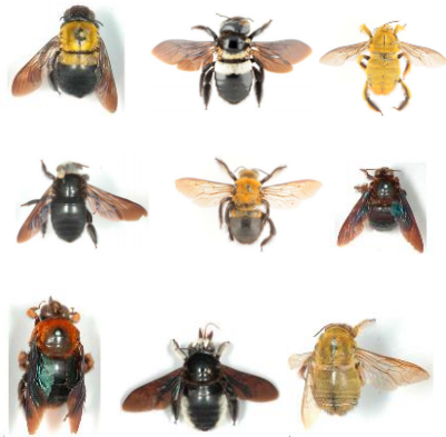
Les Xylocopes du Burundi, grands pollinisateurs

Les insectes pollinisateurs sont des transporteurs des cellules reproductrices mâles ou femelles parce que la plante ne peut pas se déplacer vers un autre individu qui pourrait être son partenaire sexuel. Les insectes pollinisateurs les plus connus sont les abeilles comme les Xylocopes . Le Burundi compte plus de 26 espèces de Xylocopes déjà dénombrées.