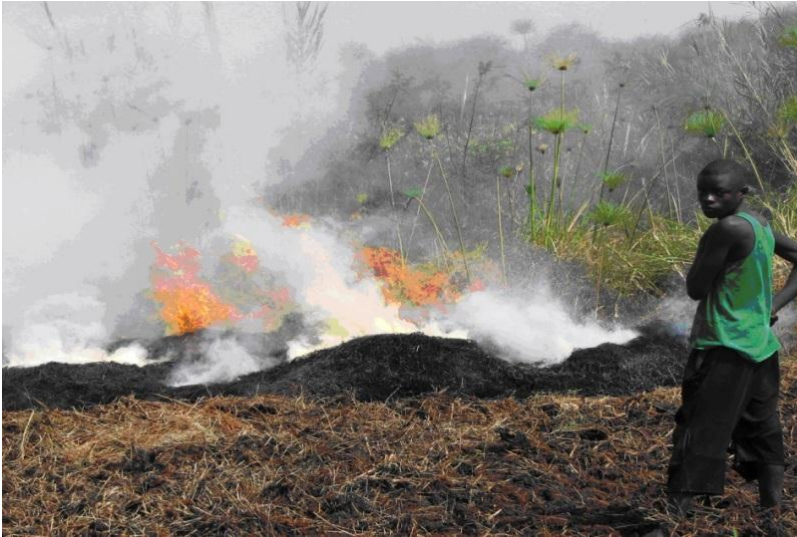
Feux de brousse

La saison sèche est pourtant une période critique où la floraison devient naturellement rare. Les feux de brousse viennent ainsi mettre en danger la vie des pollinisateurs. Ainsi, le brûlage des zones herbacées peut causer une mortalité importante des pollinisateurs présents, principalement par la destruction des œufs et des larves.