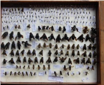
Boîtes avec des insectes

Les pollinisateurs sont des acteurs qui sont essentiels dans la production des plantes. Leur activité permet la reproduction de la grande majorité des plantes sauvages et cultivées. Les insectes tels que les abeilles, les guêpes et les mouches sont les principaux pollinisateurs des plantes naturelles et cultivées apportant ainsi une grande contribution écologique et économique à la nature et à l'homme.