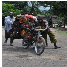
Les palmiers à huile dépendent aussi de la pollinisation par des coléoptères

Nombreuses plantes cultivées dépendent des insectes en particulier les abeilles soit pour donner des fruits soit pour l'amélioration de leurs rendements quantitatifs ou qualitatifs.