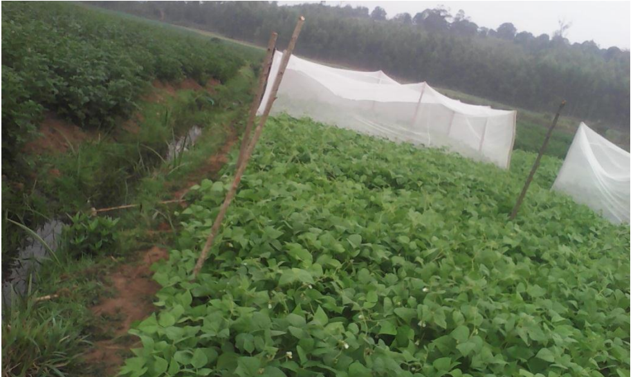
Parcelles soumises en pollinisation libre et protégée

Les premiers résultats ont montré que les parcelles laissées en pollinisation libre ont produit beaucoup de quantité de haricots par rapport aux parcelles couvertes par les tissus moustiquaires. Cela prouve que les pollinisateurs contribuent à l'amélioration des rendements qualitatifs et quantitatifs.