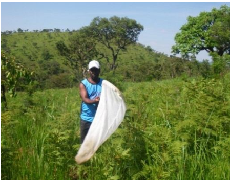
Collecte des insectes sur les fleurs avec filets entomologiques

Au Burundi, des études sur les insectes pollinisateurs ont été effectuées depuis 2009 et ont permis la collecte d'un grand nombre d'insectes pollinisateurs. La collecte des insectes pollinisateurs peuvent de faire avec plusieurs méthodes. Le filet entomologique est très utilisé et les bocaux jaunes sont aussi utilisés.