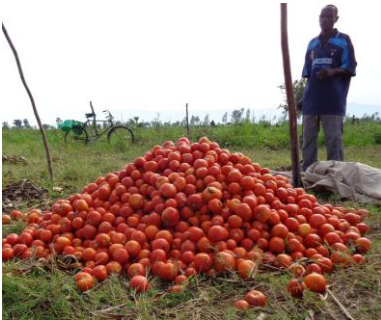
Les fruits de tomates issus du service de pollinisation

En agriculture, la contribution des abeilles est considérable sur les rendements quantitatifs mais aussi qualitatifs de très nombreuses cultures. Il est estimé que 1/3 de la production alimentaire d'une nation dépend directement de la pollinisation.