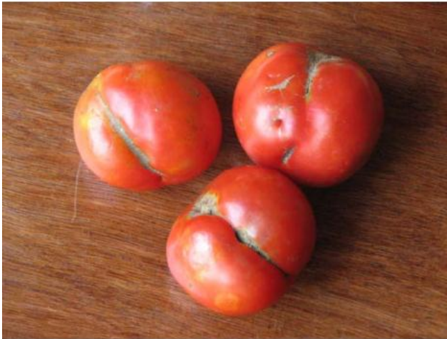
Tomates dont la pollinisation n'était pas complète : déformation longitudinalement orientée

En cas de mauvaise pollinisation, la qualité des fruits n'est pas bonne car ils possèdent des malformations du fait que la pollinisation n'a pas été complète. On constate que certaines malformations sont orientées longitudinalement, traduisant que certaines parties de l'ovaire n'ont pas été pollinisées.