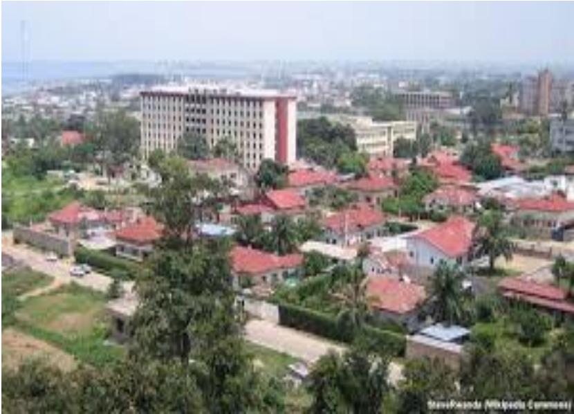
Une vue de la ville de Bujumbura

Ainsi les cours intérieures de toutes ces maisons et les bords des routes sont dominées par des gazons et des plantes ornementales fournissant très peu de fleurs pour les insectes pollinisateurs.