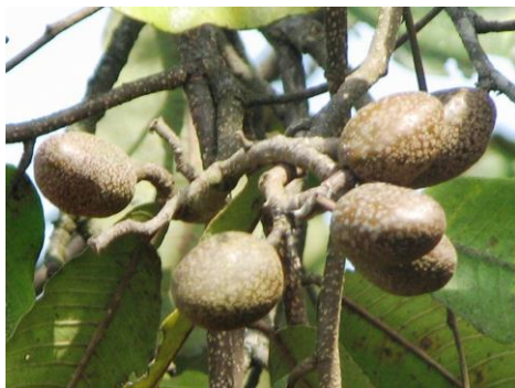
Parinari curatellifolia (Umunazi) dépend de la pollinisation

L'espace agricole n'est pas le seul à dépendre des pollinisateurs. En effet, nombreuses plantes des milieux naturels nécessitent une pollinisation par les insectes pour se maintenir. Par conséquent, il est urgent de favoriser le maintien et le développement de beaucoup des pollinisateurs afin de soutenir non seulement l'agriculture, mais aussi beaucoup des plantes naturelles qui sont les grands éléments constitutifs d'une forêt.