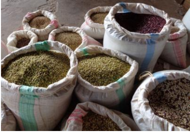
Les graines de haricots issues du service des pollinisateurs