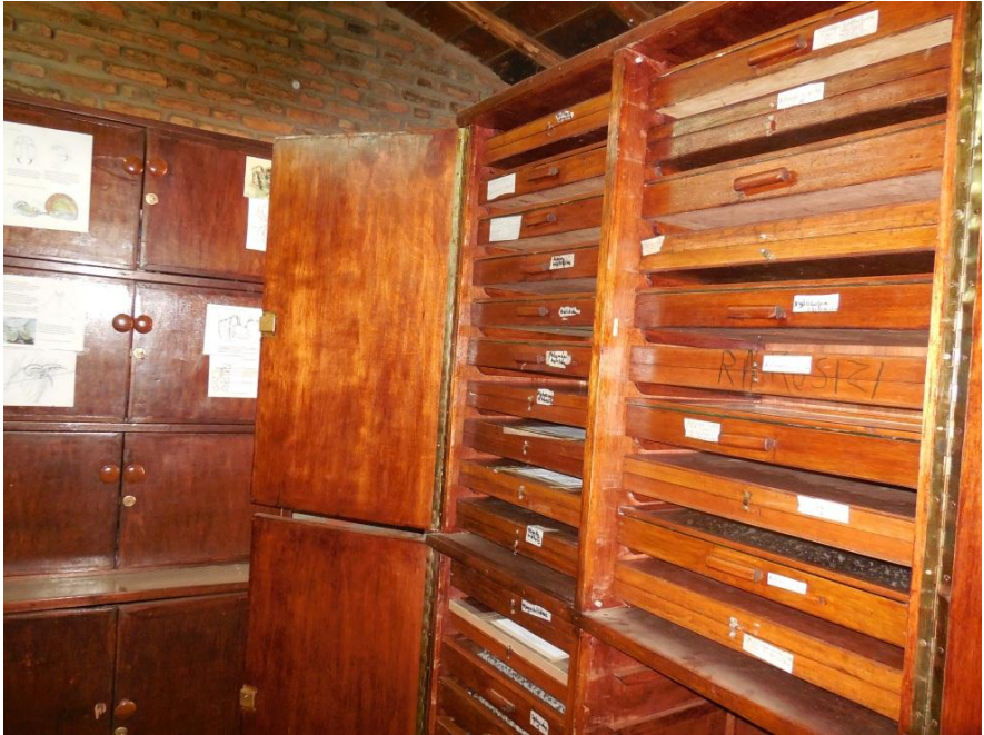
Armoires de conservation des insectes pollinisateurs à l'OBPE

Actuellement, 107 espèces d'abeilles ont été collectées et déterminées dans différents milieux du Burundi et sont conservées au Laboratoire de Recherche en Biodiversité à l'Office Burundais pour la Protection de l'Environnement (OBPE).