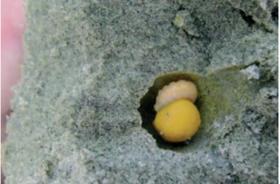
Les œufs des abeilles pondus dans le sol

Ces insectes visitent les fleurs à la recherche de nourriture et, pour certains, de partenaires sexuels, d'abris ou de matériaux pour la construction du milieu où ils pondent leurs œufs. Les abeilles pondent leurs œufs dans le bois ou dans le sol.