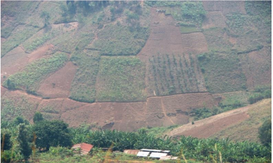
Habitat transformé en milieu agricole sans végétation forestière

Le pollinisateur en milieu agricole est donc confronté en permanence à l'alternance entre famine et surabondance.