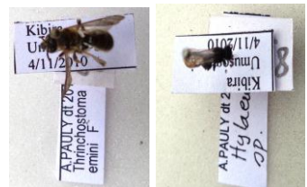
La Kibira abrite plusieurs espèces d'insectes pollinisateurs