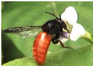
Plusieurs herbacées sont pollinisées par des insectes variés

L'espace agricole n'est pas le seul à dépendre des pollinisateurs. En effet, nombreuses plantes des milieux naturels nécessitent une pollinisation par les insectes pour se maintenir. Par conséquent, il est urgent de favoriser le maintien et le développement de beaucoup des pollinisateurs afin de soutenir non seulement l'agriculture, mais aussi beaucoup des plantes naturelles qui sont les grands éléments constitutifs d'une forêt.