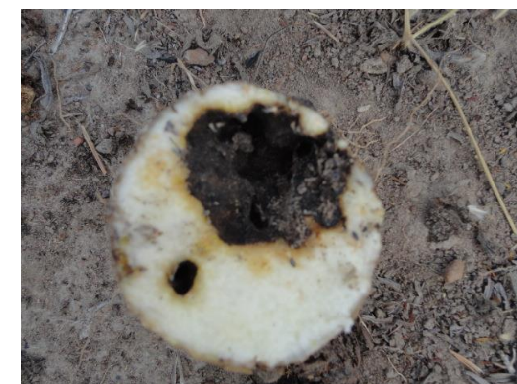
L'intérieur du tubercule est creux, dû à la consommation de la chair par les termites ce qui entraîne des pourritures