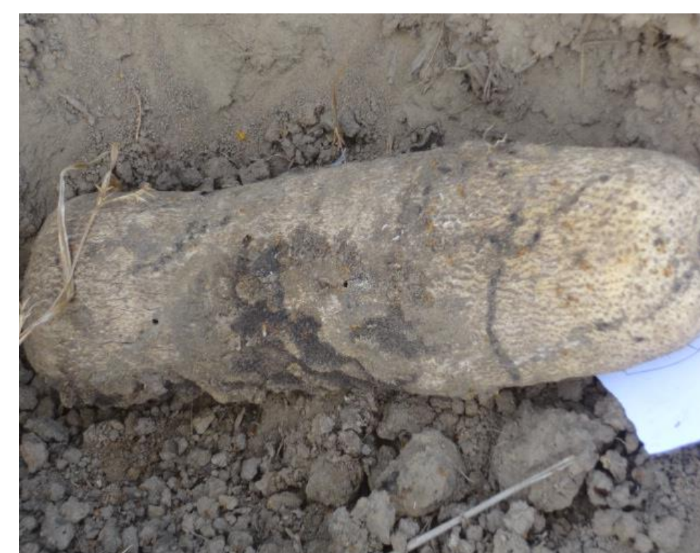
Dégât pas visible à l'extérieur du tubercule