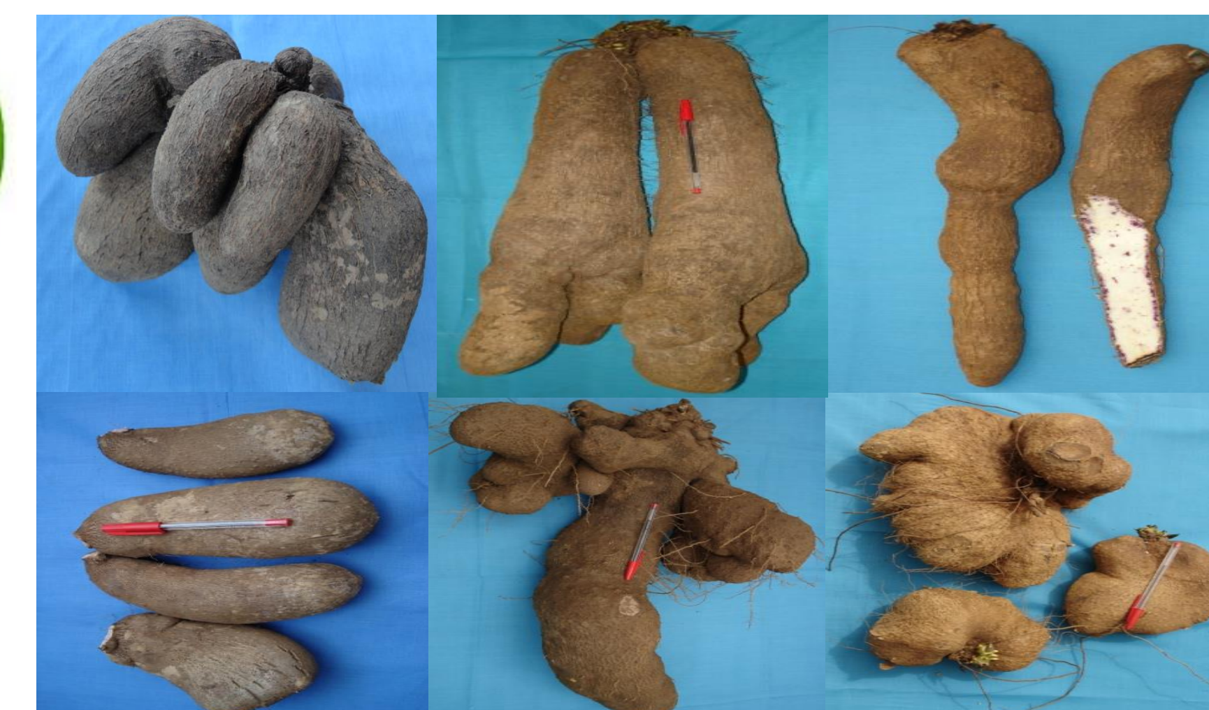
Utilisation de variétés locales tolérantes/ résistantes