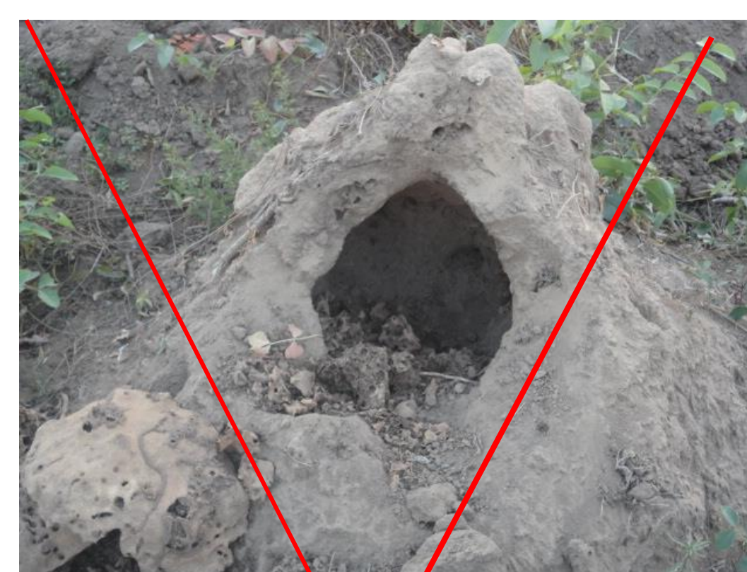
Destruction des termitières