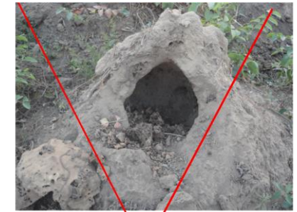
Destruction des termitières