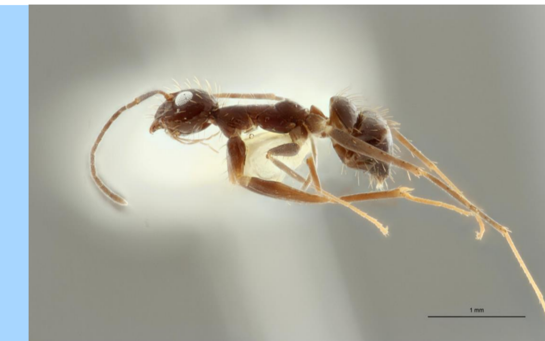
La fourmi folle Paratrechina longicornis , appelée communément la fourmi du sucre. On la trouve dans toutes les villes de Côte d'Ivoire