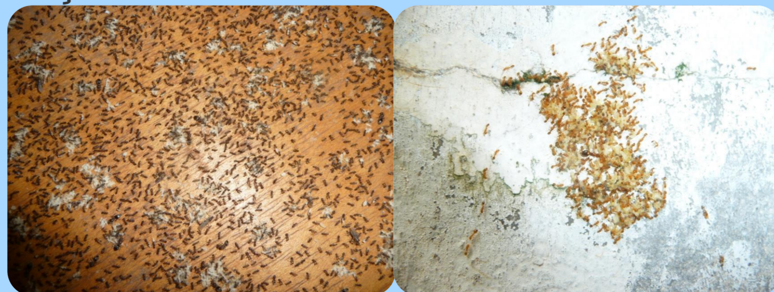
Fourmis anthropophiles envahissantes, les taches blanches sont des larves et des œufs.

Toutes les fourmis ne sont pas nuisibles. Il en existe par contre plusieurs qui une fois transportées par l'homme grâce au commerce, au transport et au tourisme, sont capables de s'installer sur un nouveau territoire et d'y prospérer de façon durable.