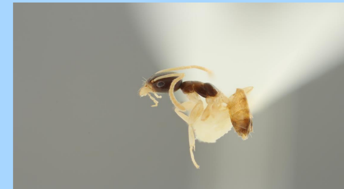
La fourmi odorante Tapinoma melanocephalum . Cette fourmi est abondante dans les maisons et dégage une odeur forte.