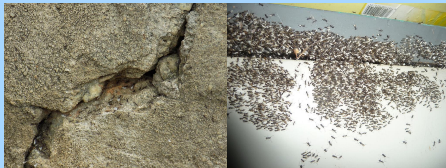
Fissures servant de nid à la fourmi du sucre

Une fourmi indigène ou exotique peut être anthropophile si elle vit et se reproduit dans les infrastructures humaines (fissures, cavités dans les murs, installations électriques, etc...)