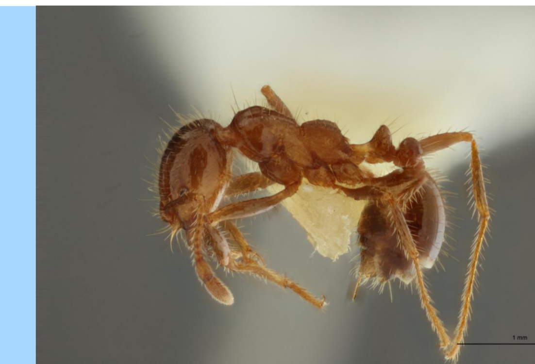
La fourmi de feu tropicale Solenopsis geminata . C'est une espèce nouvelle pour la Côte d'Ivoire.