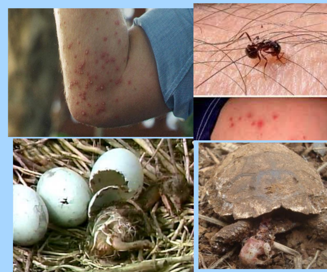
Problèmes causés par les fourmis anthropophiles envahissantes