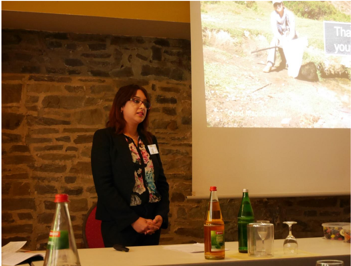
Photo 5: Présentation orale au symposium international des syrphidés en Allemagne