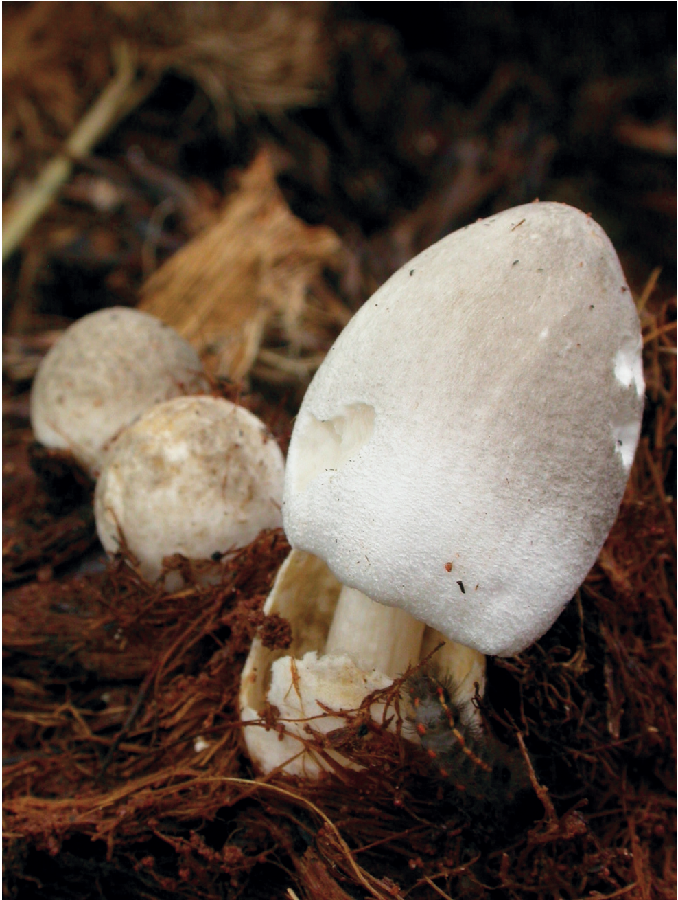
Fig. 152. Volvariella volvacea s.l.