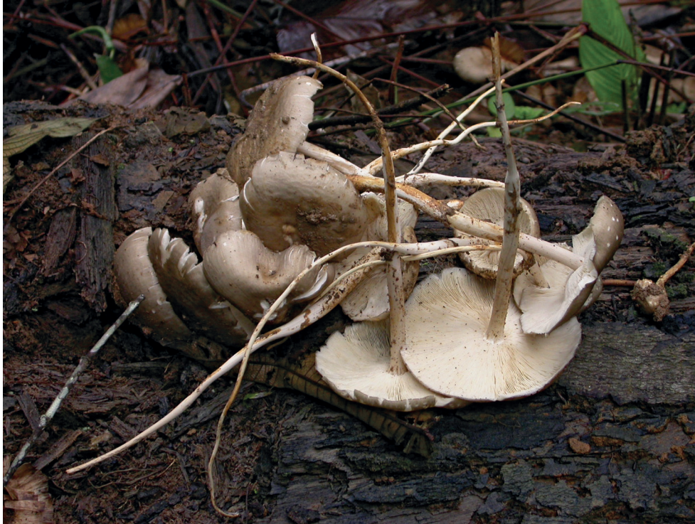
Fig. 148. Termitomyces striatus s.l.

Notes – Une grande variabilité dans la coloration du revêtement piléique est observée chez Termitomyces striatus (Beeli) Heim et a conduit certains auteurs à distinguer de nombreuses variétés et formes au sein de cette espèce, non reprises ici dans la liste des synonymes.