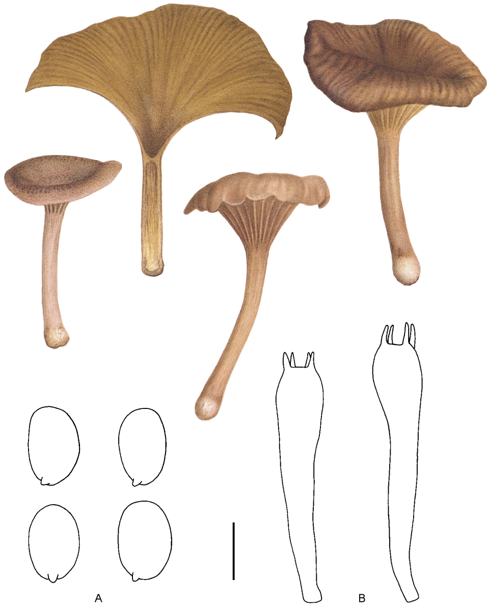
Fig. 150. Trogia infundibuliformis . A. Spores; B. Basides. Echelle = 5 \mu\text{m} (A), 10 \mu\text{m} (B).