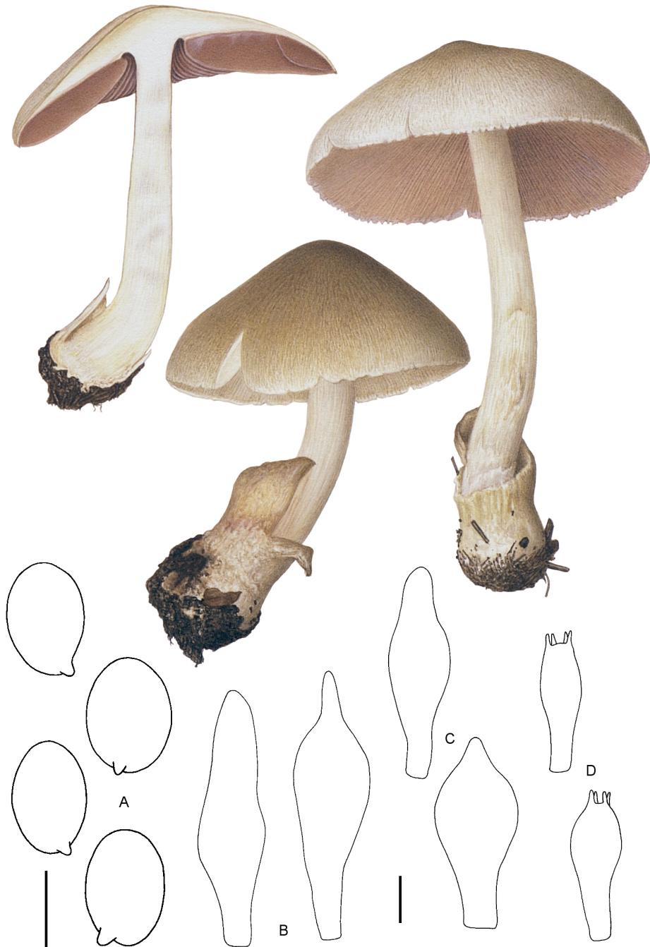
Fig. 151. Volvariella volvacea s.l. A. Spores; B. Pleurocystides; C. Cheilocystides; D. Basides. Echelle = 5 \mu\text{m} (A), 10 \mu\text{m} (B-D).