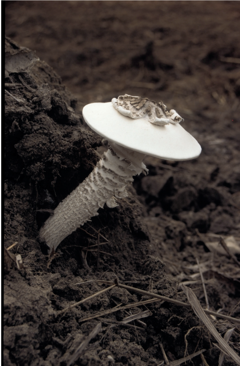
Fig. 146. Termitomyces schimperi .

Notes – Cette espèce peu fréquente est très facilement reconnaissable à ses sporophores massifs, à revêtement blanc d’abord entièrement couvert d’une couche squamuleuse brunâtre, ne subsistant finalement que sous forme d’une plaque détachable au sommet du chapeau et en dessous de l’anneau.